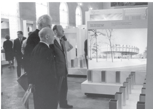
Выставка «Архитектура США», Ленинград, 1965 г.

К каждой выставке, которая проводилась ЮСИА, агентство подбирало русскоговорящих гидов, по возможности разбирающихся в ее предмете. В их обязанности входило не только рассказывать об экспонатах, но и отвечать на любые вопросы, которые могли быть интересны советским посетителям. Американский исследователь Томас